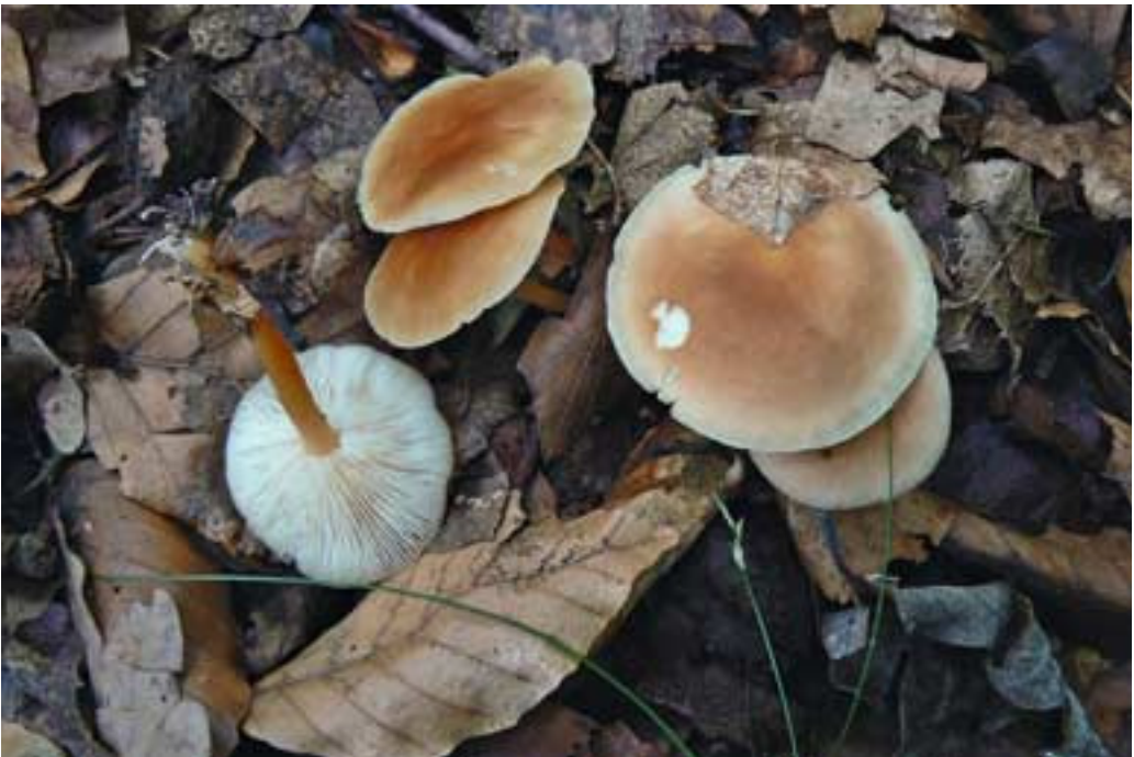
Abb. 8 (oben): Stäubender Zwitterling ( Nyctalis asterophora ) auf altem Schwärztäubling Abb. 9 (unten): Waldfreund-Rübling ( Gymnopus dryophilus )