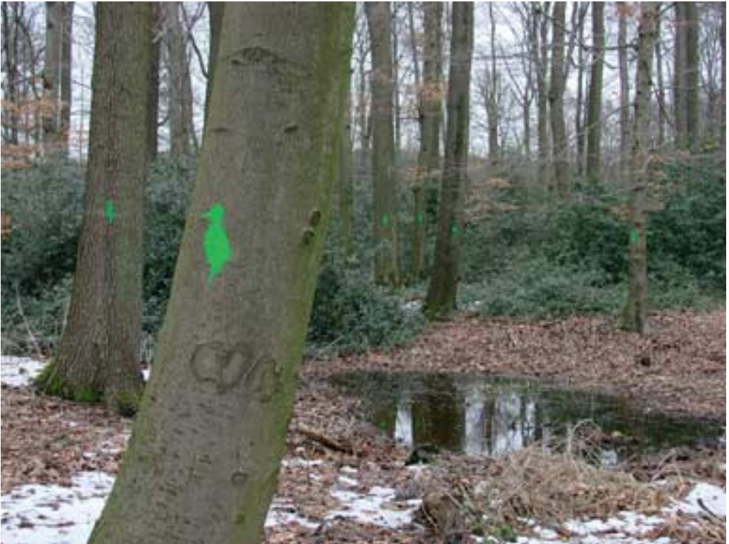
Abb. 4: Strothbachwald im März 2010 mit Stechpalmen und gekennzeichneten Biotopbäumen.

Der Waldgesellschaft des Fago-Quercetum petraeae (auch Violo-Quercetum oder Lonicero periclymeni-Fagetum) entspricht die aktuelle Vegetation sehr weitgehend: Die Baumschicht wird von Rotbuche, Stiel- und Traubeneiche gebildet, hinzu treten in der zweiten Kronenschicht Sandbirke, Hainbuche, Schwarzerle, Eberesche und Stechpalme, in der Strauchschicht neben der häufigen Stechpalme und den ebenfalls verbreiteten Himbeeren und Brombeeren auch Faulbaum, Späte Traubenkirsche, Roter und Schwarzer Holun-