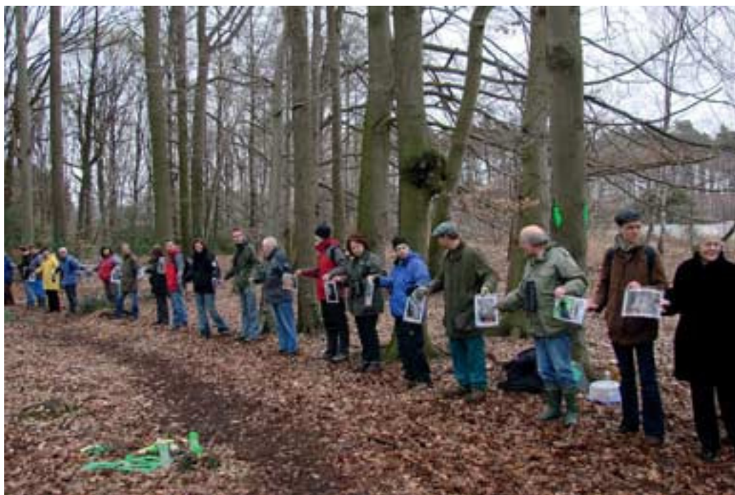
Abb. 18: Mit Bildern der Höhlenbesiedler protestiert die Menschenkette (Ausschnitt) gegen die Vernichtung ihres Lebensraumes.