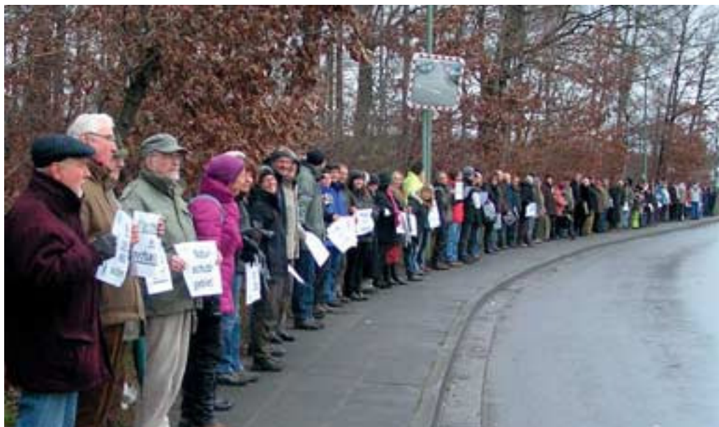
Abb. 20: Natur macht keine Kompromisse: 100 Demonstranten formulieren Klartext.