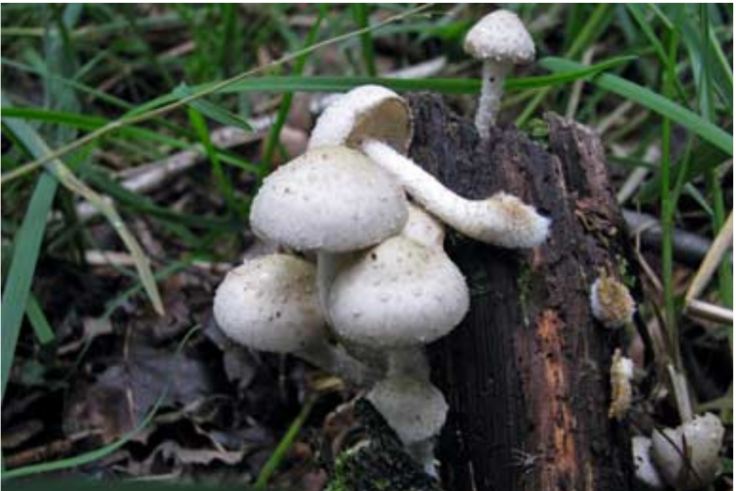
Abb. 10 (oben): Echter Zunderschwamm ( Fomes fomentarius ) Abb. 11 (unten): Strohblasser Schüppling ( Pholiota gummosa )