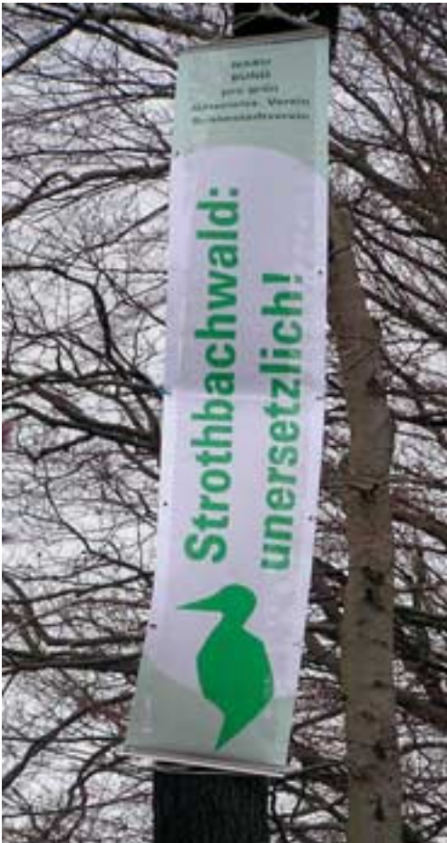
Abb. 19: Unmissverständlich: Dieser Wald muss geschützt werden!

Speditionsfirma, Stadtrat, Oberbürgermeister und Verwaltung der Stadt Bielefeld wurden erneut aufgefordert, die Hängepartie um den Strothbachwald unverzüglich zu beenden, den ökologisch und kulturgeschichtlich höchst wertvollen Wald endlich wirksam unter Schutz zu stellen und auf Dauer zu erhalten. Den Bürgerwillen verdeutlichten Transparente, die hoch in den Bäumen aufgehängt wurden. In der Tat scheint es nun an der Zeit, auch in Bielefeld stärker darauf zu hören, wie die Bürgerinnen und Bürger die Zukunft ihrer Stadt gestalten möchten. Die Zeit politi-