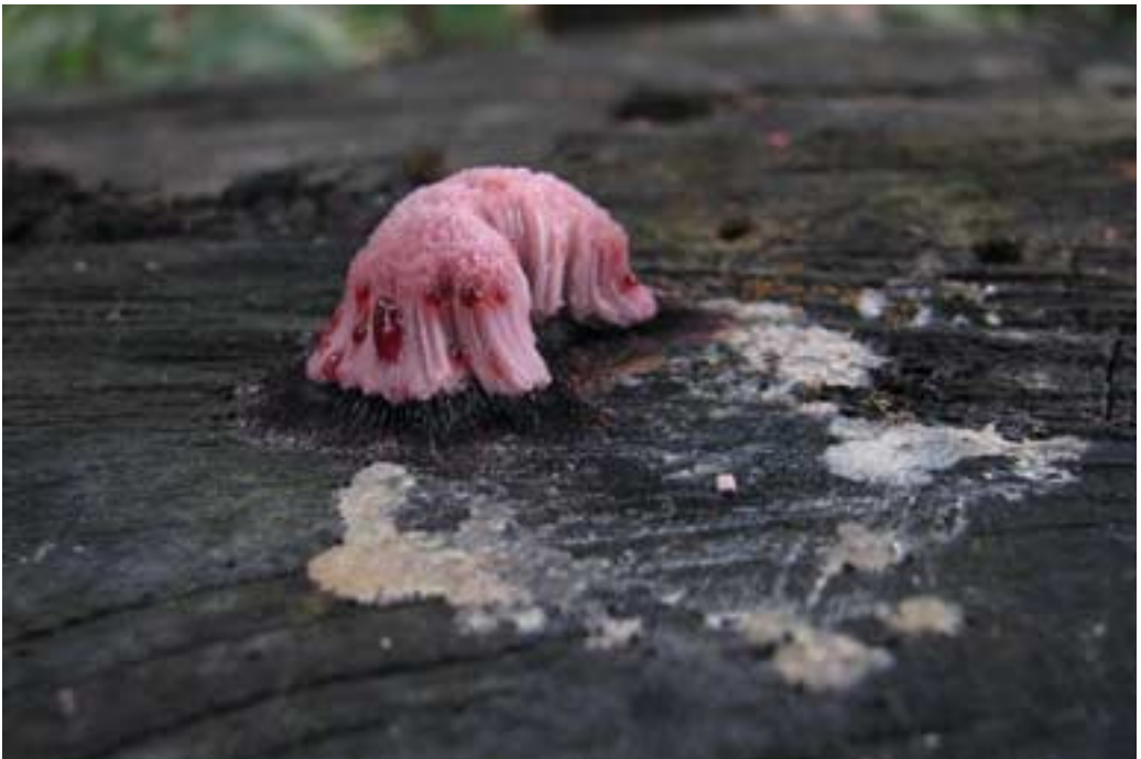
Abb. 14 (oben): Ablösender Rindenpilz ( Cylindrobasidium laeve ) Abb. 15 (unten): Ein Schleimpilz ( Stemonitis cf. axifera )