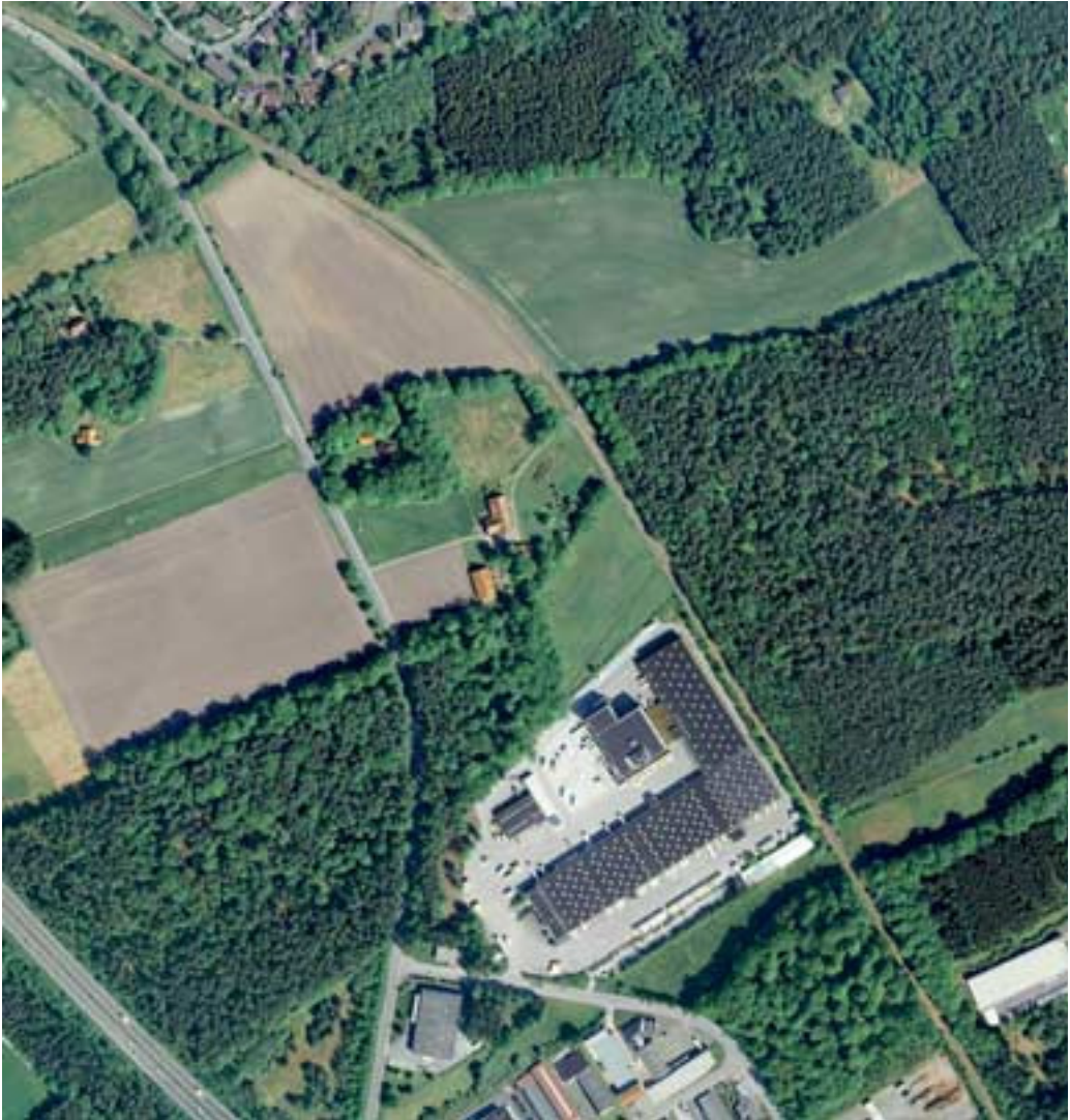
Abb. 3: Im aktuellen Luftbild von 2008 wird der Strothbachwald bereits auf 3 Seiten durch Bebauung eingekreist, die Grünbrücke Evessel durch die Spedition Wahl & Co. radikal unterbrochen.