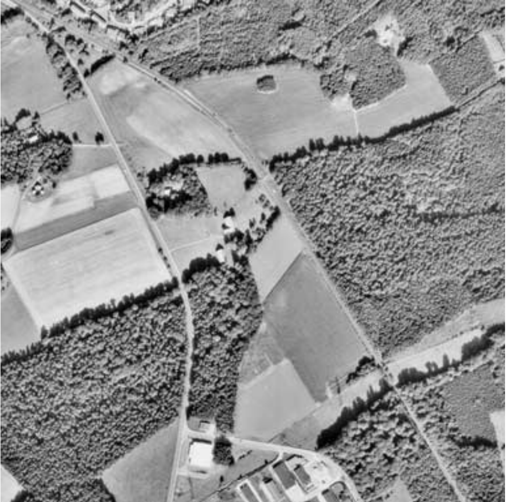
Abb. 2: Die Luftbildkarte 1985 (Bildflug 1984) verdeutlicht den weiteren Waldverlust und die beginnende Trennung des Strothbachwaldes vom Evessellbruch, die bereits durch erste Rodungen Ende des 19. Jahrhunderts einsetzte, zeigt aber auch die großkronige Altersstruktur seines Bestandes, die im Umkreis ähnlich nur noch das Waldstück südlich des Hofes Rolf aufweist.