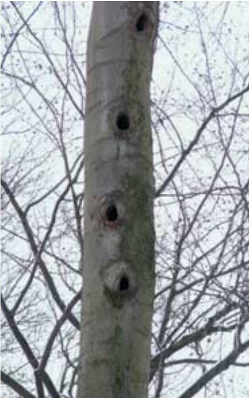
Abb. 5: „Sozialer Wohnungsbau“ im Strothbachwald: Von der Bautätigkeit des Schwarzspechts profitieren u.a. Dohlen, Hohltauben, Stare, Kleiber und Fledermäuse.

Darüber hinaus wurden im Strothbachwald weitere 182 Biotopbäume ermittelt und gekennzeichnet, die sich durch zusätzliche Spalten, Rinden- und Stammschäden, Astausbrüche und Faulstellen, Totholz und Pilzbewuchs sowie Vogelhorste auszeichnen und damit essentielle Lebensraumelemente für eine Vielzahl von Arten darstellen. Gerade die Kombination von zahlreichen Höhlenquartieren als Brut- und Winterquartier, dem reichen Nahrungsangebot im Altholz und den waldnahen Wasserflächen ergeben einen heute seltenen Faktorenkomplex, der beispielsweise für den Kleinen Abendsegler unverzichtbar zu sein scheint (s. unten).