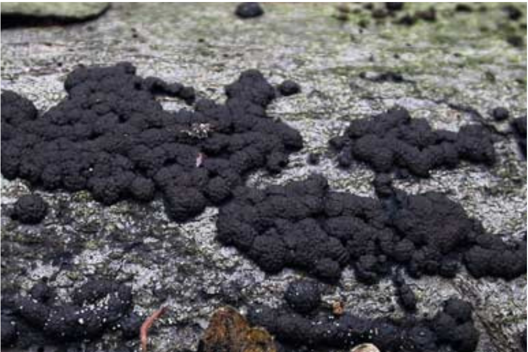
Abb. 12 (oben): Herber Zwergknäueling ( Panellus stipticus )