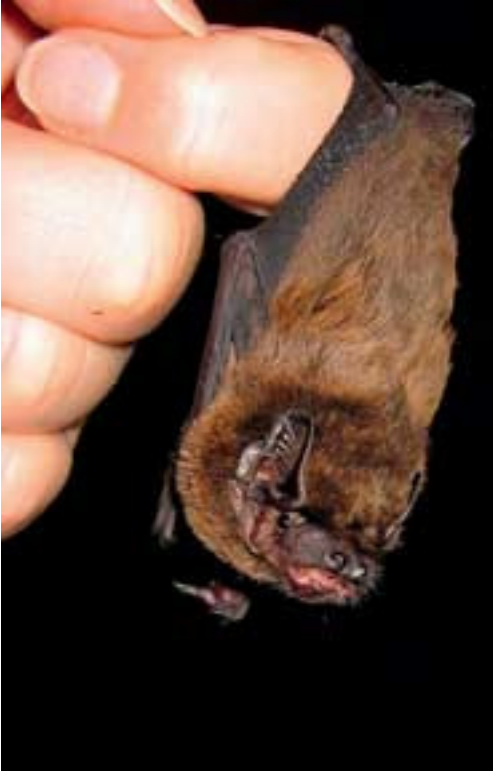
Abb. 17: In unserer Hand: Wir Menschen entscheiden über das Schicksal des Kleinen Abendseglers.