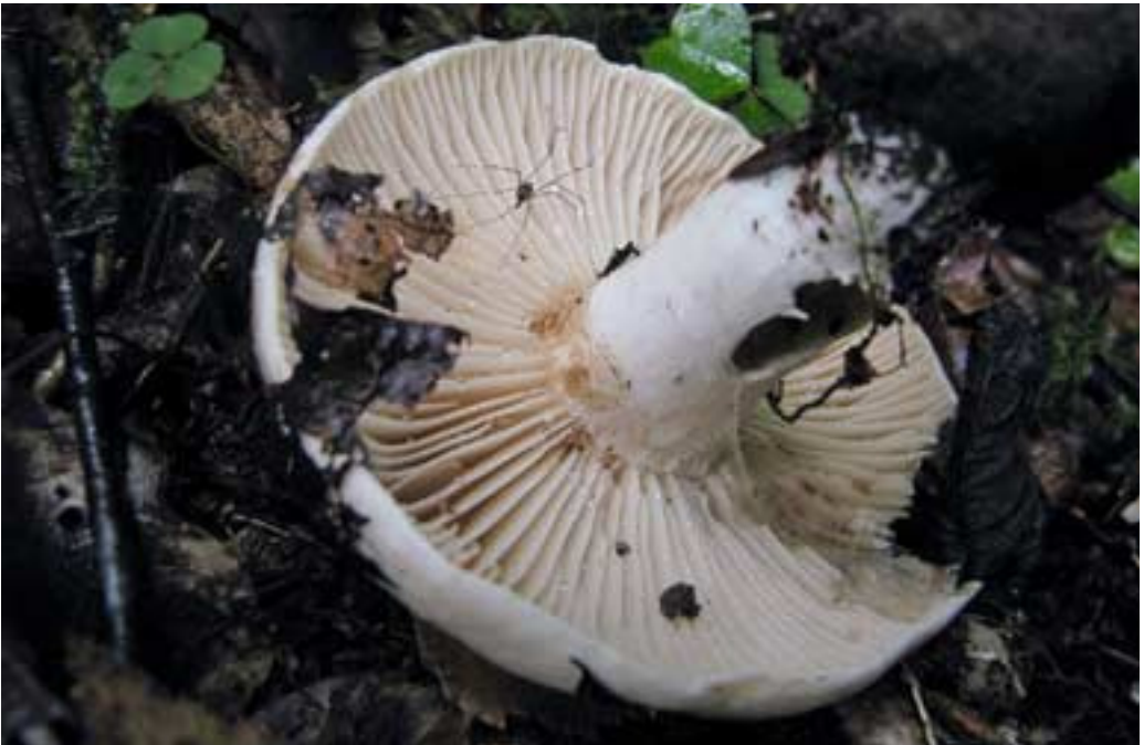
Abb. 6 (oben): Olivbrauner Milchling ( Lactarius turpis )