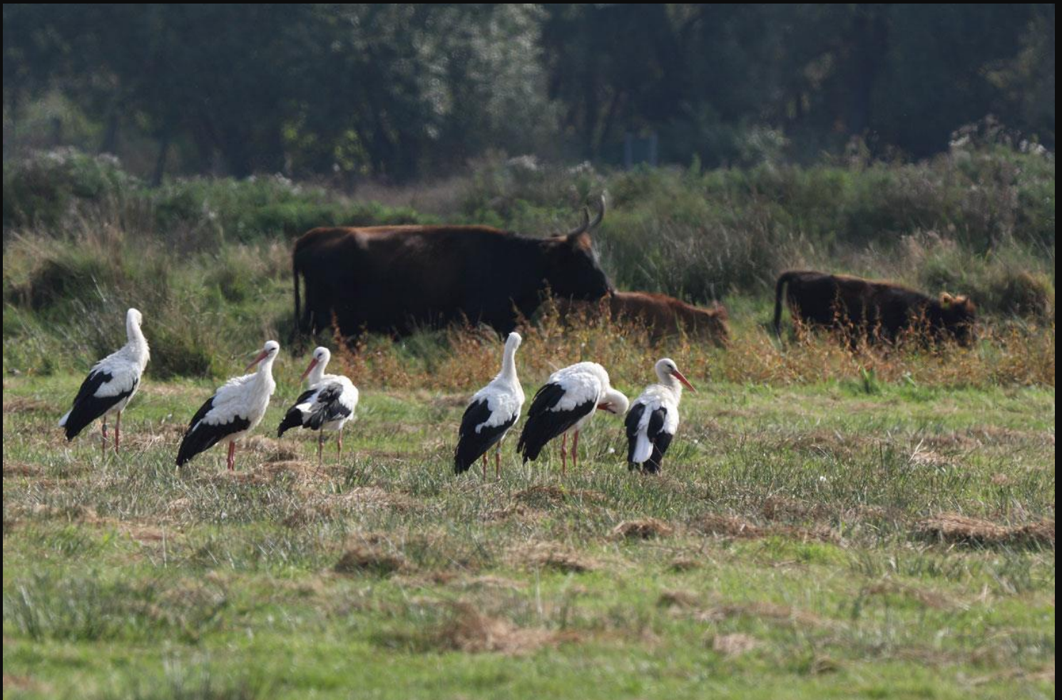
Fast wie in der Johannisbachau